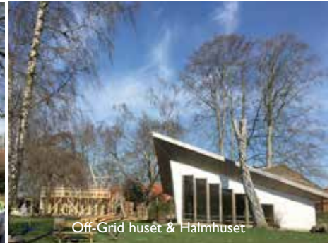
Off-Grid huset & Halmhuset