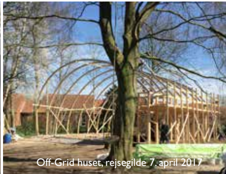
Off-Grid huset, rejsegilde 7. april 2017